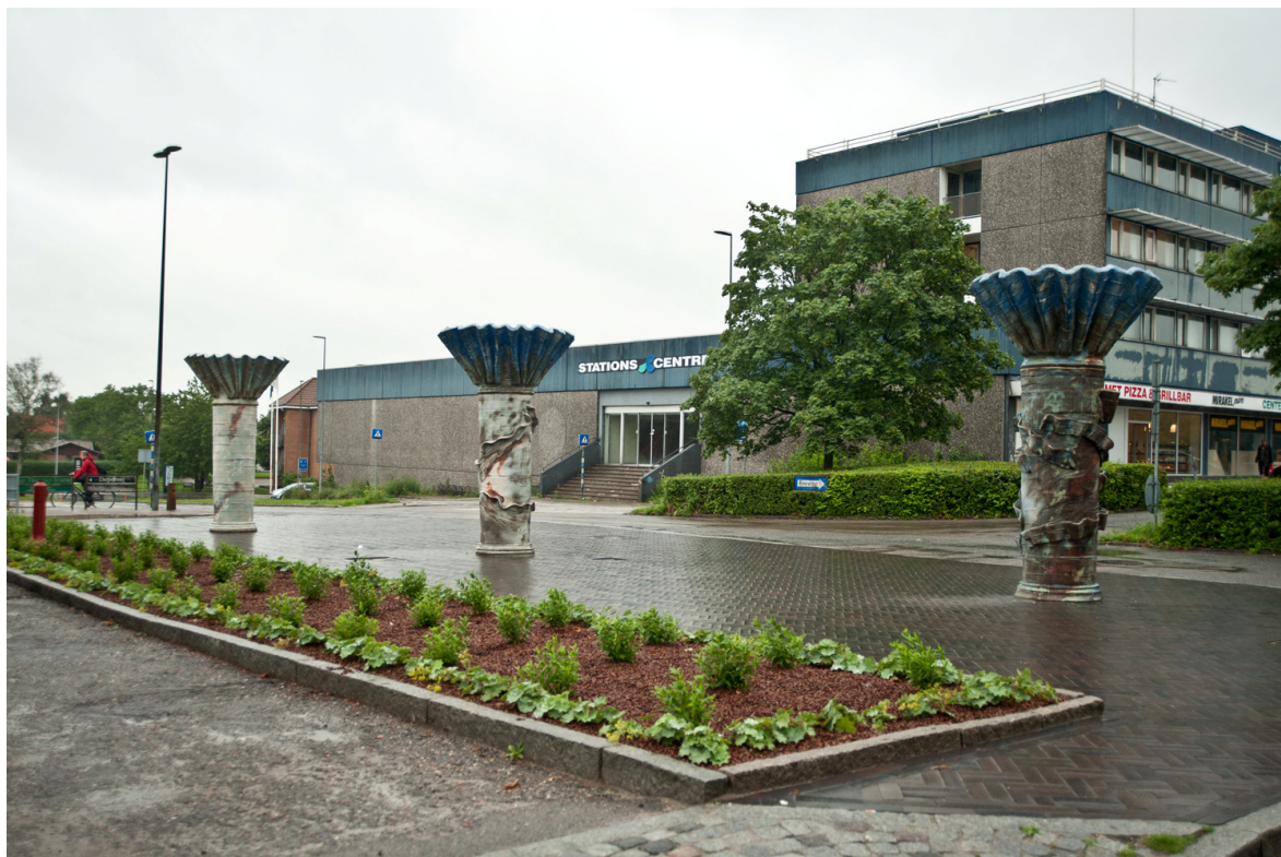
Billede af ny plads til skulpturerne "fang bolden"